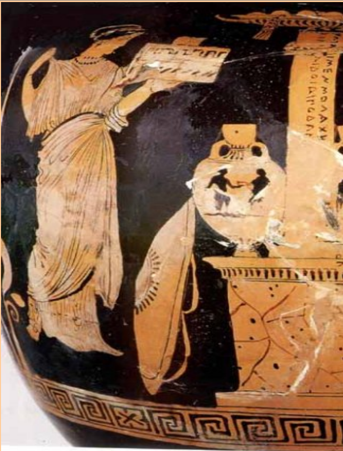
Vase grec (Louvre)