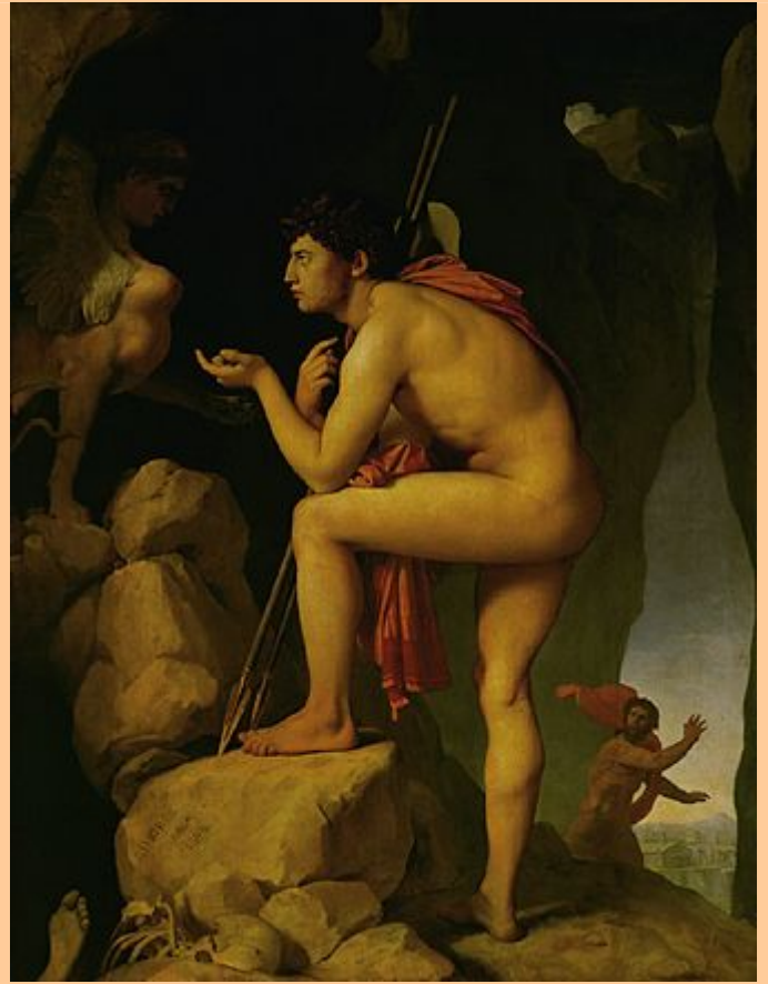
Jean Auguste Dominique Ingres Œdipe et le Sphinx