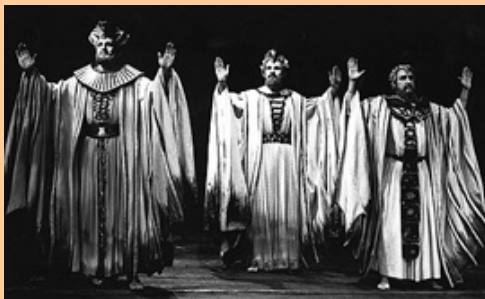
Photo de l'Antigone de Sophocle

L'action de la tragédie de Sophocle commence au moment où le nouveau roi, Créon, vient de célébrer les funérailles d'Étéocle et de proclamer l'interdiction d'en faire autant pour Polynice, considéré comme traître à sa patrie pour lui avoir fait la guerre. Antigone, au nom de la piété filiale et des lois divines supérieures aux lois humaines, refuse la décision de Créon et procède aux rites funéraires. elle fut alors enfermée dans un tombeau où elle se donna la mort. Hémon, son fiancé (le fils de Créon), la découvrit et se suicida sur son cadavre. Eurydice, sa mère (épouse de Créon), se suicida également.