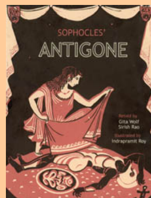
Affiche de l'Antigone de Sophocle