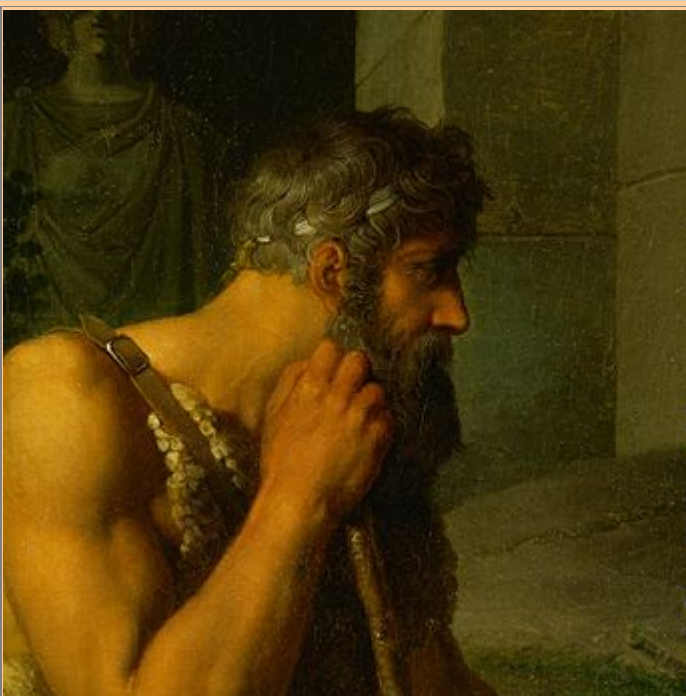
Johann Peter Krafft Œdipe et Antigone 1809