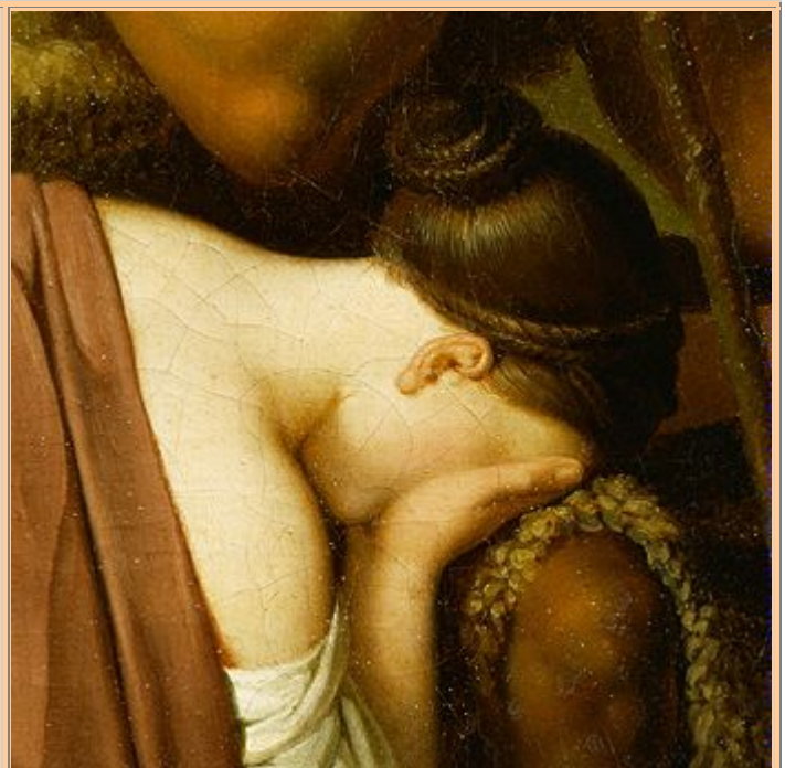
Johann Peter Krafft Œdipe et Antigone 1809